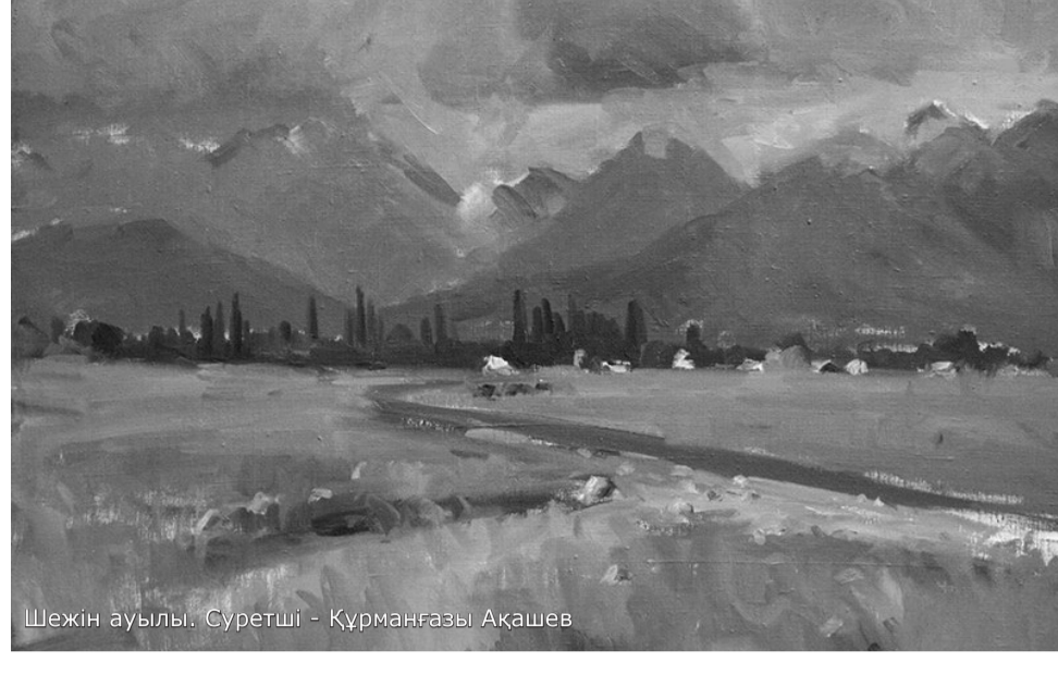
Шежин ауылы. Суретші - Құрманғазы Ақашев