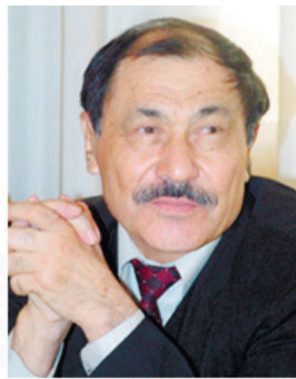
Бексұлтан НҰРЖЕКЕҰЛЫ, жазушы, Мемлекеттік сыйлықтың иегері.

жомарттығын; тура жүріп, тура сөйлейтін көсемдігін бәрі бағалаған және мойындаған. Мәселен, Секер ханмен шайқастан соң, қалмақтардан түскен олжаны бөлгенде, бас қолбасшы Райымбекке 375 жылқы; Арыс ханды жеңген соң, 400-ден артық бас; Төреханды жеңген соң, 400-ден астам жылқы тиесі болады. Бірақ ол бұл жүлкеден бірде-бір мал алмай, бәрін шайқасқа қатысқан немесе шайқаста қаза тапқандардың отбасына, мүгедектер мен кедей-кепшікке бөліп бергізеді (сонда, 133, 143, 161 - бет). Оның осындай адалдығы мен адамгершілігін бәрі бағалаған. Сондықтан Райымбек жайындағы тарихқа дүңғаза сөзбен емес, ақ-қараны ажырататын көзбен ңңу керек. Және кейбіреулерше Райымбектің атын шығарам, атағын аспандатам деп тыраштанудың түкке қажеті жоқ, өйткені ол өлместей атағын бізсіз-ақ өзі шығарып кеткен.