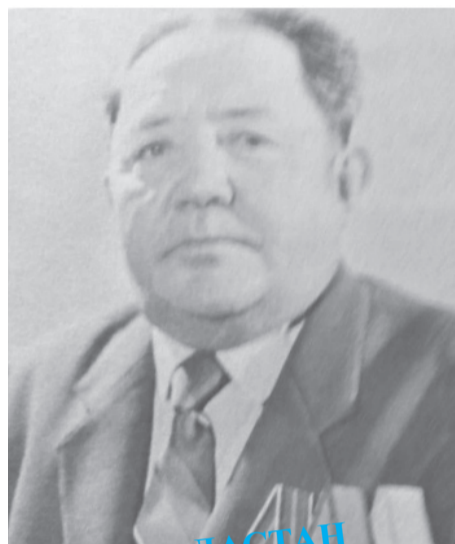
ҒҰМЫР – ДАСТАН