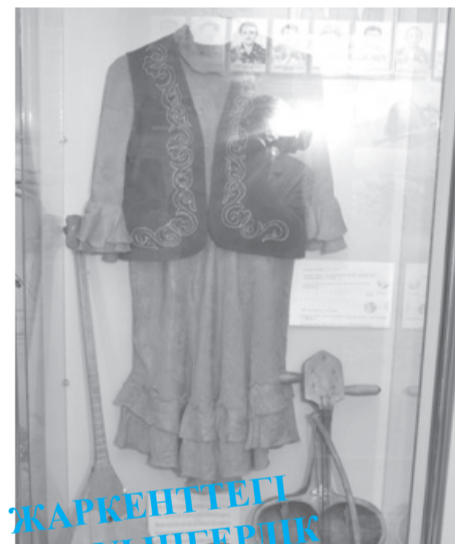
ЖАРКЕНТТЕГІ «ЖАҰЫНҒЕРЛІК ДАҢҚ МУЗЕЙІ» – ЖӘДІГЕРЛЕР ҚОЙМАСЫ