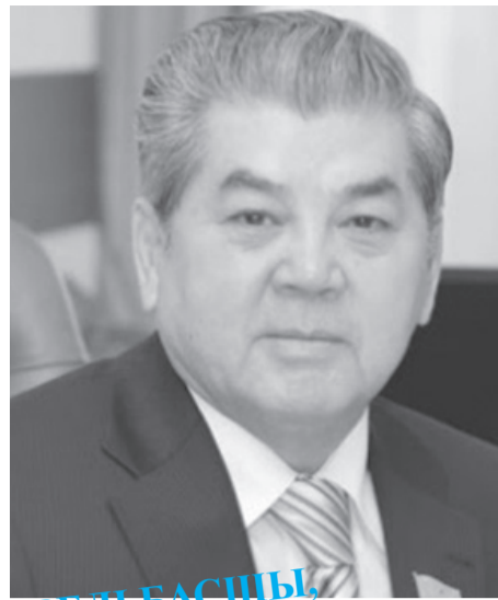
ӨРЕЛІ БАСШЫ, ШЕБЕР ДИПЛОМАТ