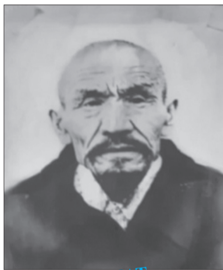
САЯСИ ЗҮЛМАТ КЕЗЕҢІ