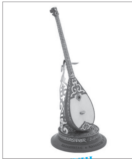
«ДОМБЫРА КҮНІ – ҰЛТТЫҢ ҮНІ»