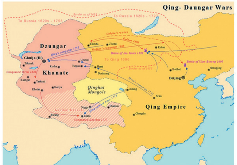
Жоңғардың жорық жолдары

Жоңғар бірнеше ғасыр бойы Қазақ хандығына қауіп төндірген жауы болып тұрғанымен Цинь империясының батысқа ірге кеңейтуін бір ғасырға дейін тоқтатып, манжурлердің Орта Азияға ықпал етуіне мүмкіндік бермеді. Қалмақтар мен Жоңғарлар Патшалық Ресейдің Тұран даласына жасаған экспанциясына да ең үлкен тосқауыл қойған күш болды. Жоңғар мен қалмақ ыдырағаннан кейін орыс патшалығының сахараға басқан адымы тездей түсті. Қазақ халқында «Жауың да ер болсын» деген тәмсіл сөз де дала заңына бағынап, досына адал, жауына қатал болған, көшпелі жауынгер жоңғарларға қаратылса керек. Жоңғар мен қалмақ