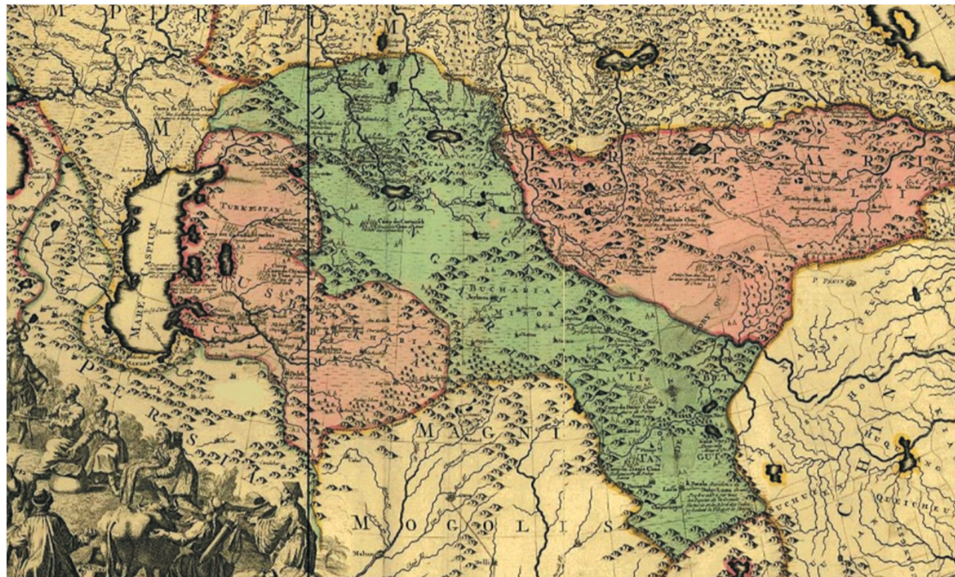
Құба-қалмақ дәуірі.

1490 жылдары Ойрат империясы қайта әлсіреп, Құбылай ұрпағы Батмөңке даян хан ойраттарды ойсырата жеңеді. Осымен бір уақытта Моғұлстандағы Сұлтан Ахмет хан да ойраттарға қарата бірқатар жеңісті соғыстар жасайды. Тарихта ол ойраттарға танытқан қаталдығы үшін «Алаша хан» (Қанішер хан) атанған болатын. 1505 жылғы жойқын соғыстарда қалқа мен цахардың біріккен күшінен жеңіліс тапқан ойраттар Моңғолиядан ығыстырылады. Олар Алтай асып Моғұлстан жұртының жайылымына таласады. Таласты соғыстарда моғұл тайпаларын жеңіп батысқа қуады. Моғұл тайпаларынан 400-500 мың халық 1507-1508 жылдары шығыстағы ұлан-байтақ жайылымдарынан айырылып батысқа босып кетеді, бұлар кейін қазақ құрамына енеді. Бұған қоса Шайбани ханмен