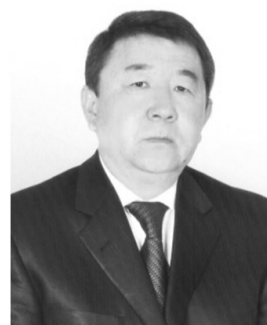
Шаяхмет АЛЖАМБАЕВ, Қазақстан Жазушылар одағының мүшесі, ақын.