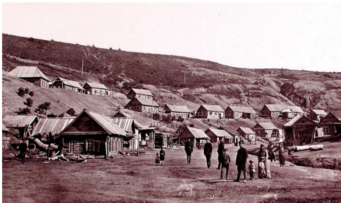
Еркін қоныстанушы тұтқындар тұратын үйлер