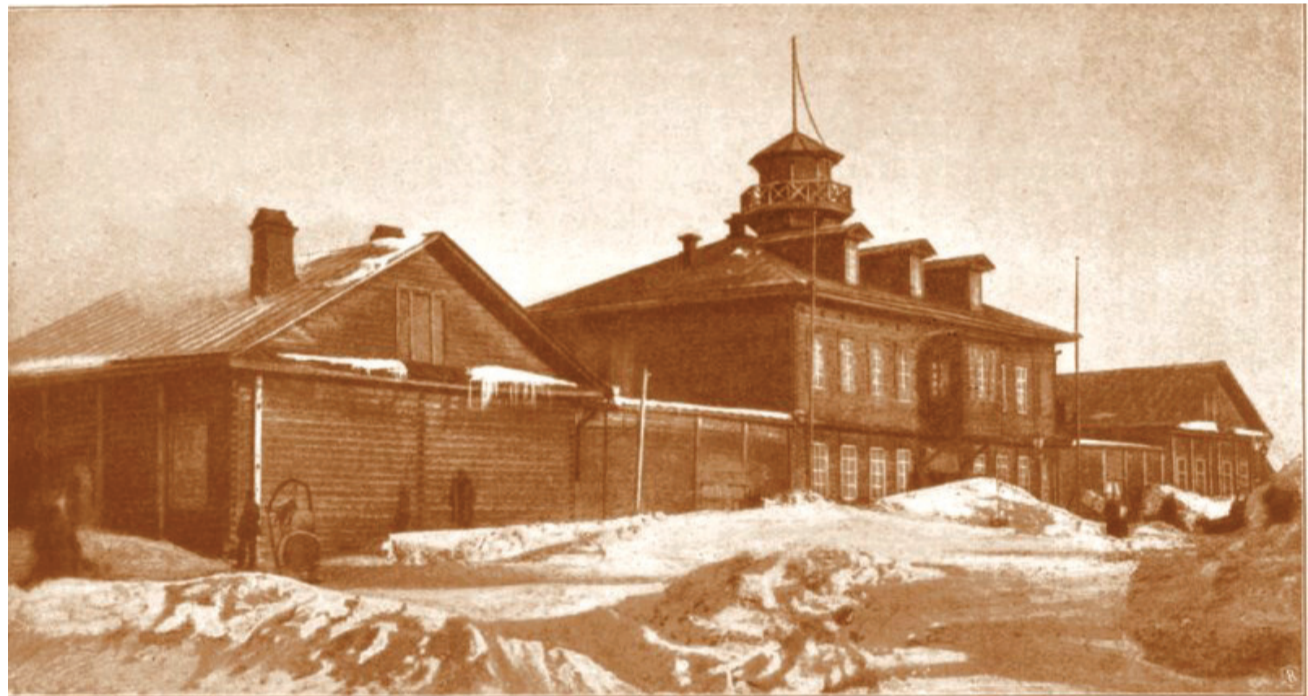
Александровский түрмесінің ғимараты