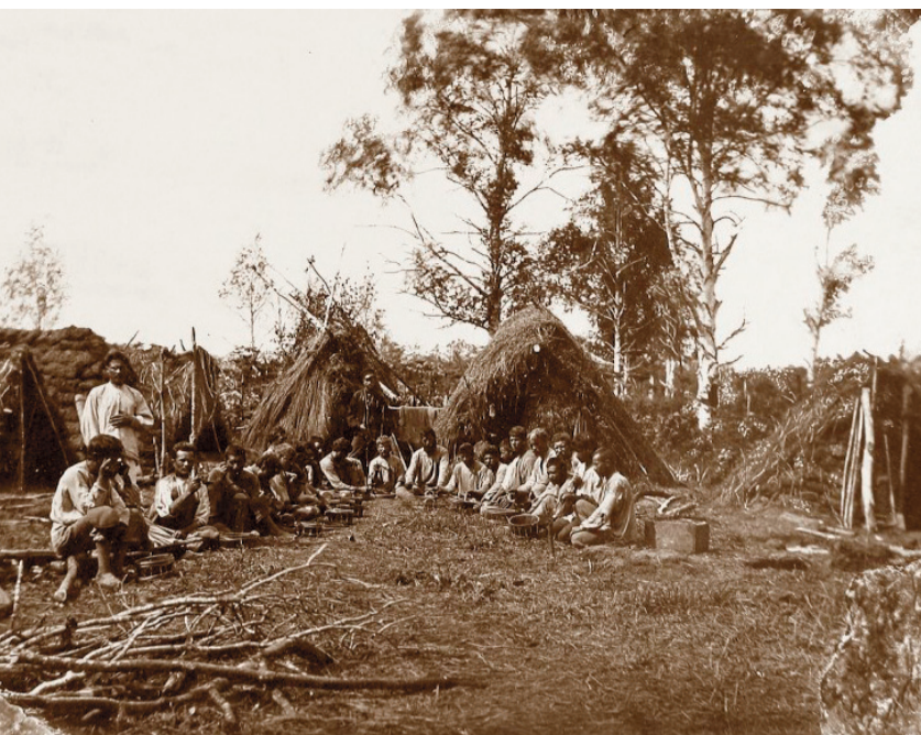
Түстеніп отырған тұтқындар