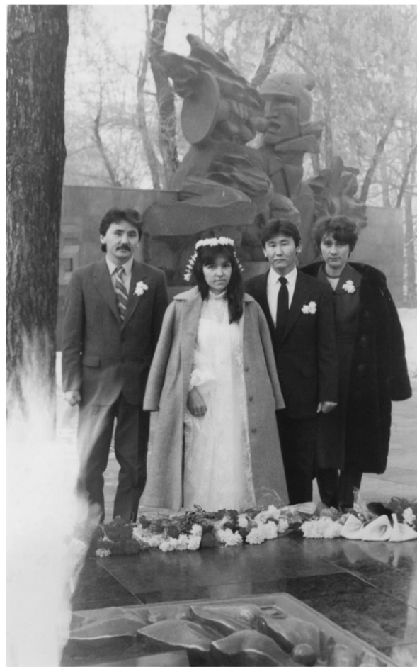
1986 жыл, 20 желтоқсан. Той күні