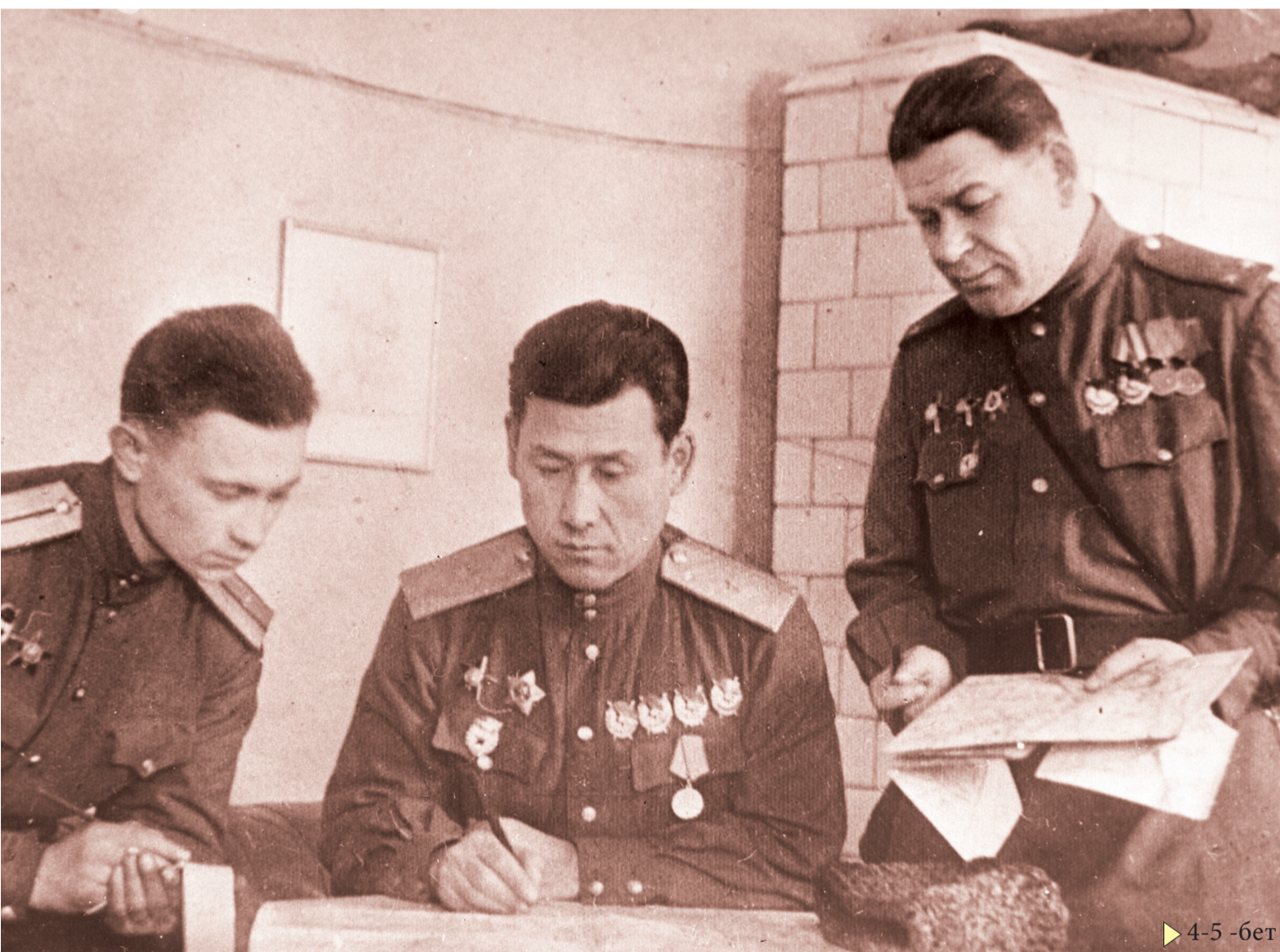
► 4-5 -бет