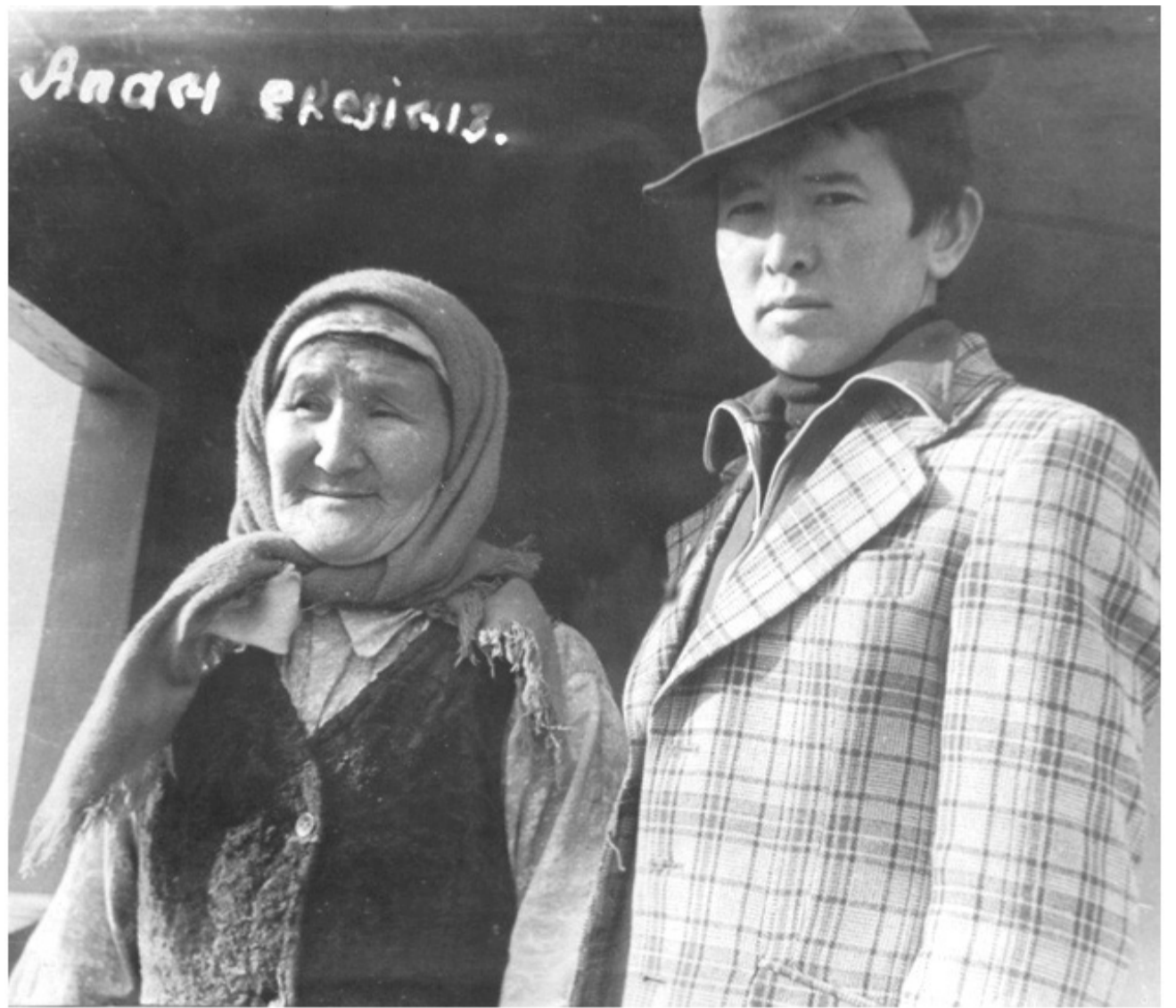
Апам екеуіміз. 1980 жыл.

ойлап тұрсам, соның бәрі өмір сабағы, тағылымды тәрбие екен ғой.