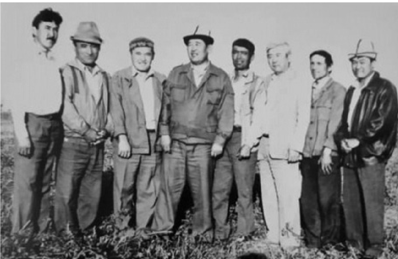
Нәби ауылдастарының ортасында